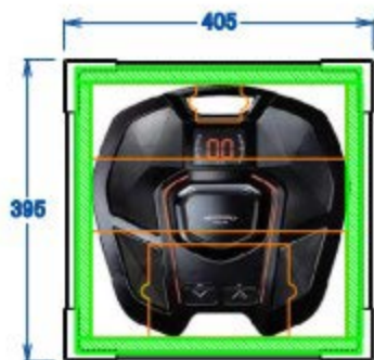
商品収納イメージ図